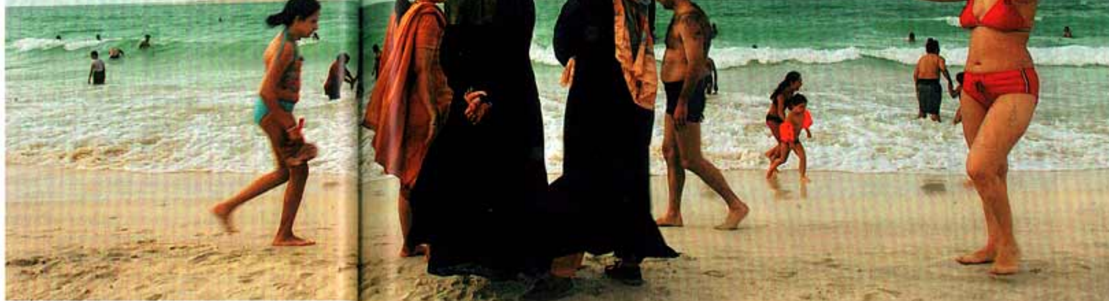
Muslimische Frauen, Badegäste am Strand von

Dubai: Der Graben ist tief, der Optimismus gering