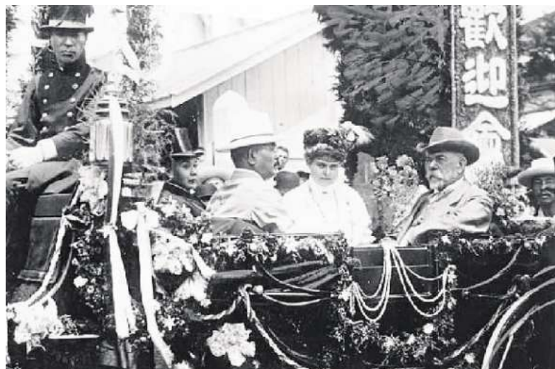
Deutsche Mediziner wurden mit Ehren überhäuft: Robert Koch (rechts) beim Besuch in Japan 1908.

deutschen Universitäten und Japan, hatte jedoch das Interesse am naturwissenschaftlichen Auslandsstudium in Deutschland langsam abgenommen.